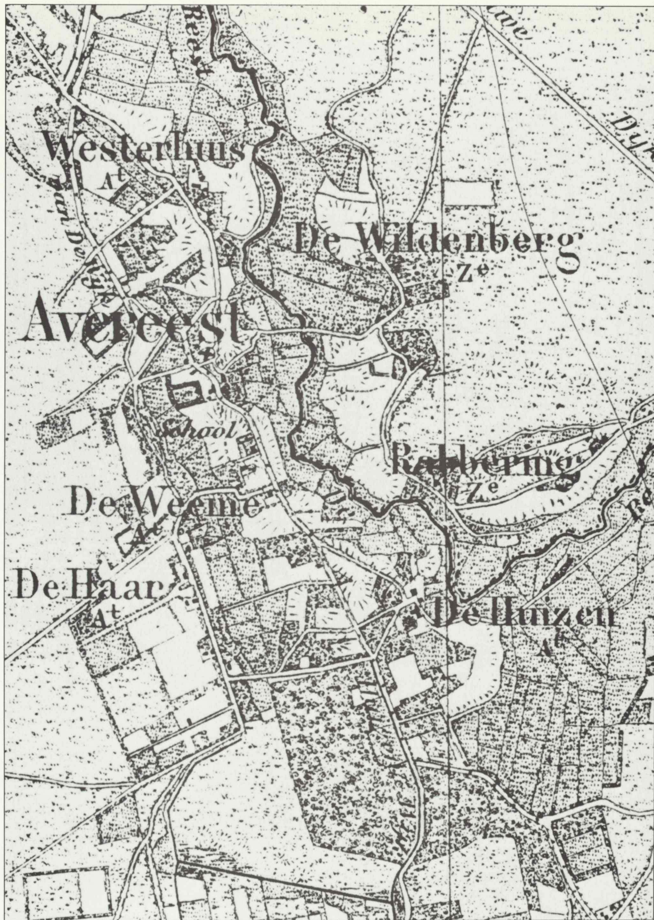
Afb. 4. Topographische en Militaire Kaart van het Koninkrijk der Nederlanden, 1973 (facsimile herdruk van 1859), blad 22, fragment.