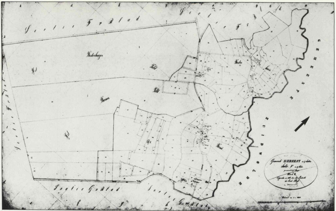
Afb. 3. Kadastrale Kaart gemeente Avereest, 1860, fragment Oud Avereest.