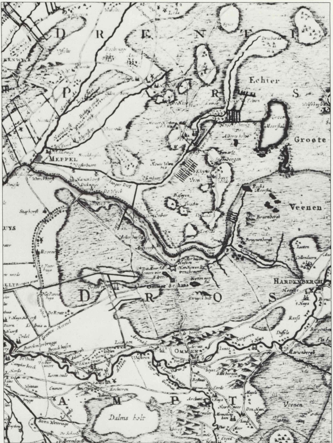
Afb. 1. N. ten Have, Transisalanica Provincia vulgo Over-IJssel, z.j. (waarschijnlijk ca. 1650), fragment.