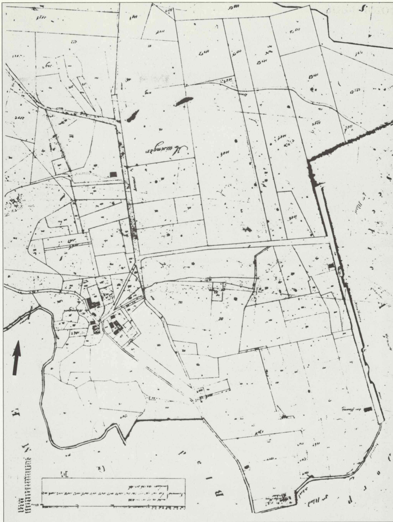
Afb. 2. Kadastraal Minuutplan gemeente Avereest, 1821, fragment Den Huizen.