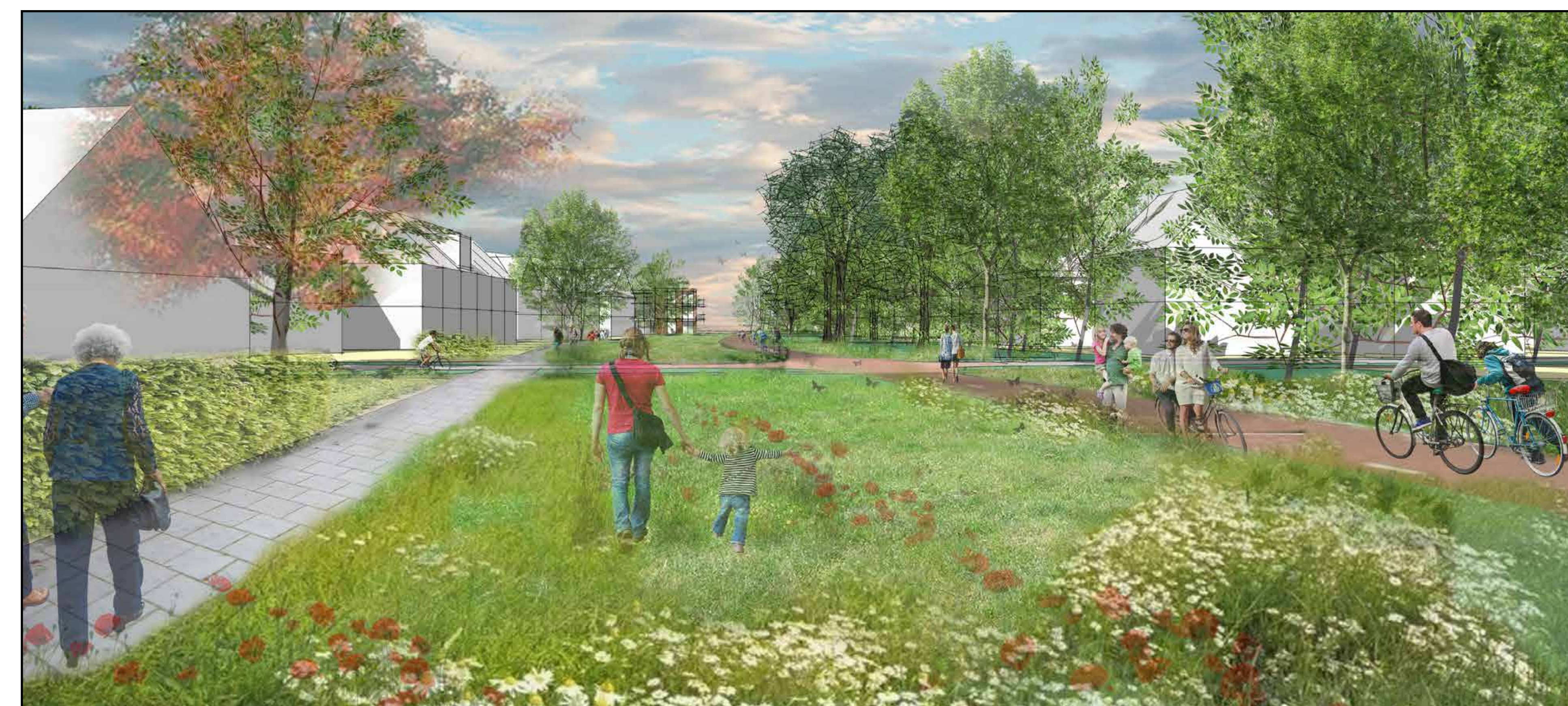
2: impressie recreatieve verbinding