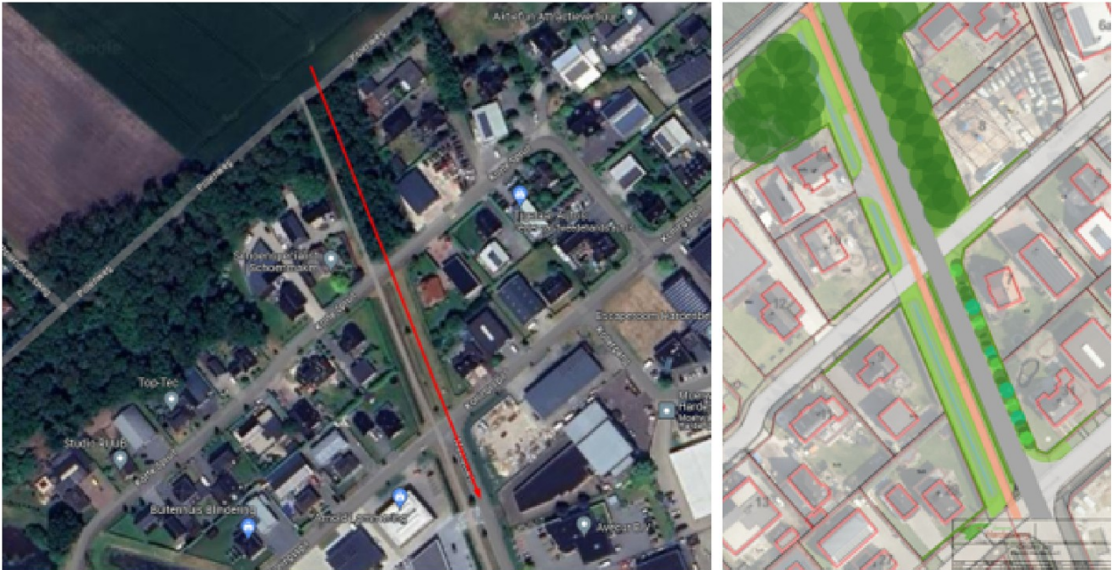
Variant via Korte Spruit