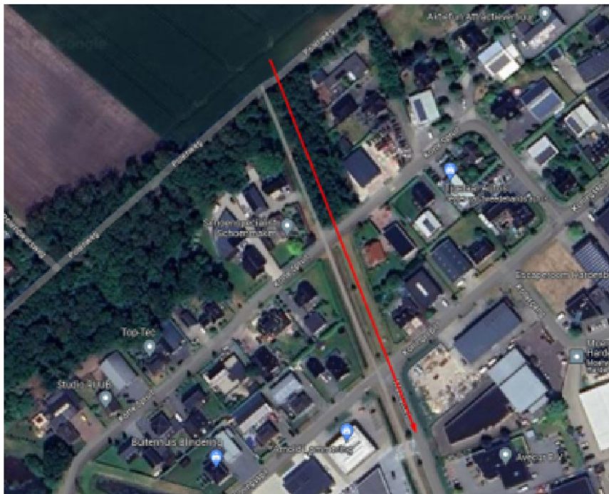
Variant via Korte Spruit