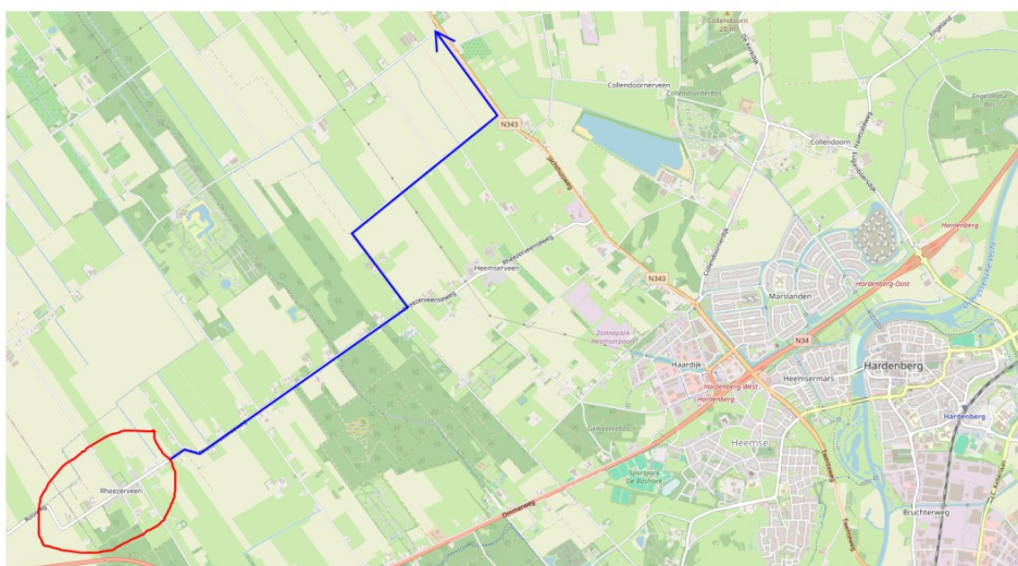
Kans op sluipverkeer via Roelofs Mulderweg

Eind 2024 heeft een overleg plaatsgevonden tussen PB Rheezeerveen-Heemserveen en de gemeente over de ontsluiting voor bedrijventerrein Heemserpoort. Uit dit overleg is gebleken dat PB niet persé tegen optie 1A of 1B is, mits de bereikbaarheid van het gebied gewaarborgd blijft. De bereikbaarheid van het gebied willen we dan ook waarborgen met de eerdergenoemde mogelijkheden. Daarnaast heeft men aangegeven tevreden te zijn met het feit dat de optie Maalstoel mee is genomen in het onderzoek. Ook werd benoemd dat variant 1B een goede koppelkans biedt om de oversteek ter hoogte van de Kroondijk op te waarderen, en daarmee de verkeersveiligheid te verbeteren. Een nadeel wat werd benoemd, is de kans op sluipverkeer via Roelofs Mulderweg in de richting van van Vaders Erf/Lutten. Het gespreksverslag is als bijlage toegevoegd aan deze notitie.