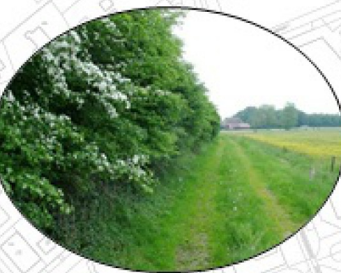
Besdragende struweelhagen met grasland