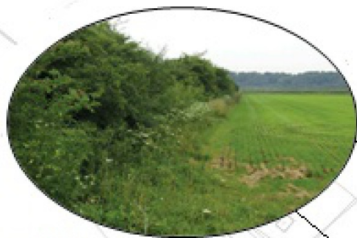
Boschages en grasland