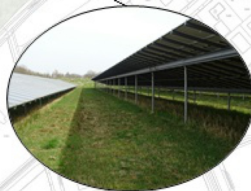
Grasland tussen en onder zonnepanelen