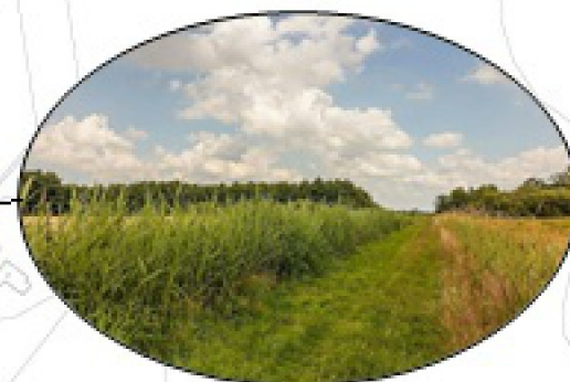
Groene verbindingen tussen burcht en foerageergebieden