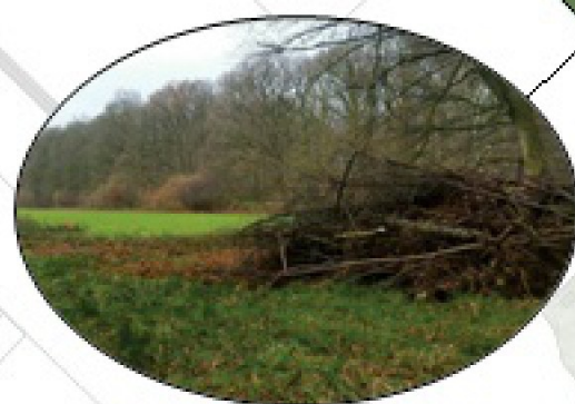
Takken- en steenhopen