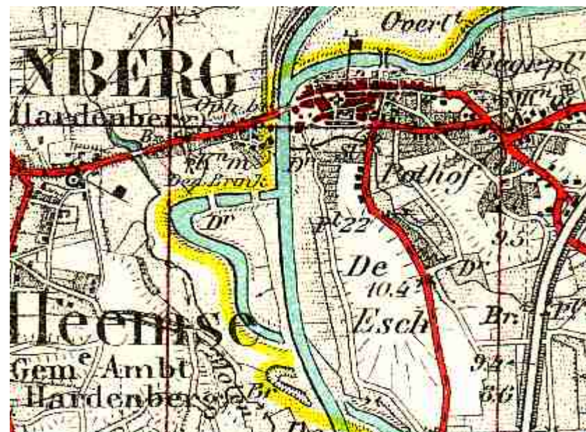
Figuur 9: Kaart van Hardenberg uit 1914

Bijna vijftig jaar later ziet een kaart van Hardenberg er al weer heel anders uit. Je kunt op de volgende kaart zien hoe de straten lopen en waar huizen gebouwd zijn: er is een begin van een stratenpatroon. Hoe de stad er ongeveer uitziet, is hier dus veel preciezer getekend dan op de vorige kaarten.