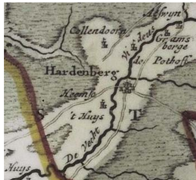
Figuur 7: kaart van de Nederlandse provincies uit 1757, detail van Hardenberg

Ook uit de volgende eeuw zijn er kaarten waar Hardenberg op voorkomt. De kaart hieronder is gemaakt in 1757 door Isaak Tirion. Ook op deze kaart is weer de Vecht getekend. Verder staan er twee wegen op die door Hardenberg lopen, net als op de kaart van 1645. De 'stip' die Hardenberg voorstelt is wel groter, maar welke gebouwen getekend zijn is nog erg onduidelijk. De rode lijn rechtsonder in de hoek is de grens met Duitsland.