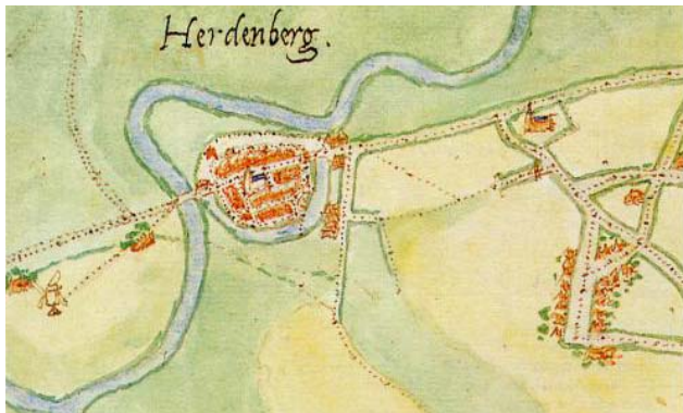
Figuur 2: Detail van de kaart van 'Hardenberg' uit 1558, gemaakt in opdracht van Filips II. Rechtsboven staat het kerkje van Nijenstede.

Een kasteel dat toen dichtbij lag, beschermde de kerk in tijden van oorlog. En die heeft de kerk zeker meegemaakt, want hij heeft er uiteindelijk bijna 1000 jaar gestaan. In 1653 is hij afgebroken of in elkaar gezakt. De kerk was zo bouwvallig, dat een verbouwing niet meer hielp. De resten van de kerk zijn in hetzelfde jaar gebruikt om een school te bouwen. Al in het begin werden de doden begraven op het kerkhof ernaast. Dit bleef zo, ook toen de kerk er al lang niet meer stond. Pas halverwege de 20 e eeuw kwam er een muur om het kerkhof.