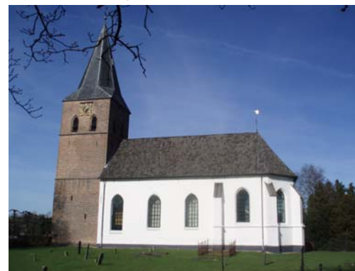
Figuur 1: De witte kerk tegenwoordig.

Wel zijn er aanwijzingen dat er rond het jaar 750 al mensen in Heemse woonden. Rond die tijd waren de zendelingen Lebuïnus en Marcellinus naar het noordoosten van Overijssel gekomen om het christelijk geloof te verspreiden. Vóór Marcellinus' dood (in 762) werd een houten kerkje gebouwd. Dat was voor de heilige Lambertus: de Lambertuskerk.