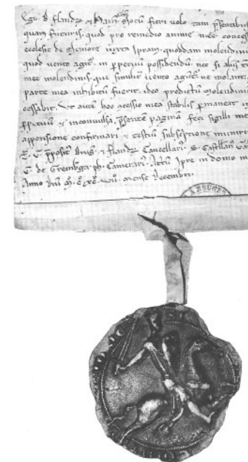
Figuur 11: Akte met zegel uit 1197

Zoals gezegd ligt de akte nog altijd in het Gemeentearchief van Hardenberg.