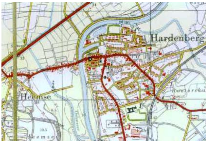
Figuur 10: Kaart van Hardenberg uit 1962

Een kaart uit de jaren '60 van de vorige eeuw lijkt al meer op onze kaarten van tegenwoordig. De kaart is heel precies: er staat niet alleen op hoe de wegen lopen en waar de huizen staan. Je kunt er ook op zien waar de bruggen zijn, de spoorlijn, de kerk en kerkhoven, de grote wegen, landerijen. Maar ook dingen als de haven en het oude zwembad zijn getekend.