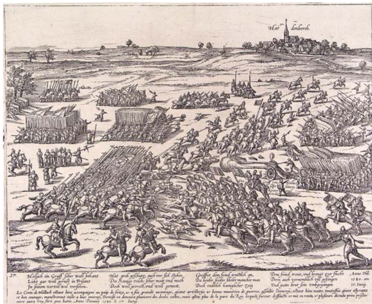
Figuur 3: Tekening van de slag op de Hardenberger heide, gemaakt door Frans Hogenberg, 17 juni 1580. Rechtsboven is 'Hardenberch' te zien.

De zestiende en zeventiende eeuw staan vooral in het teken van strijd. De bisschop laat in 1518 het kasteel en de stadsmuur van Hardenberg slopen. Eind zestiende eeuw krijgen Hardenberg en Heemse te maken met verschillende verwoestingen.