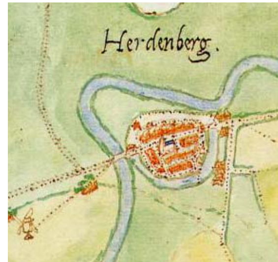
Figuur 5: Kaart van Hardenberg uit 1558

De kaart hieronder, waarvan in § 2.2 ook een gedeelte staat, is de oudste kaart die we tot nu toe kunnen vinden. Deze is gemaakt in het jaar 1558. De maker heette Jacob van Deventer. Hier is te zien dat er een gracht met water om Hardenberg gelopen heeft. Op zulke oude kaarten ging het vooral om de plaats van de belangrijke gebouwen (kerken en kloosters) in de stad zelf, terwijl we het nu belangrijk vinden dat we de weg naar andere plaatsen kunnen vinden.