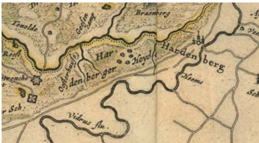
Figuur 6: Hardenberg volgens de kaart van de broers Blaeu uit ongeveer 1645

De kaart hieronder is zo'n 75 jaar later gemaakt dan de vorige. Deze komt uit ongeveer 1645 en is uitgegeven door Willem en Johannes Blaeu. Dat zijn twee broers die vanaf 1638 de uitgeverwinkel van hun vader hebben overgenomen (Willem Janszoon Blaeu). Hun zaak liep erg goed, want de vrouw van Johannes kon een groot deel van de prenten voor veel geld verkopen. Overal, zelfs in het buitenland, was bekend hoe mooi en goed hun kaarten waren.